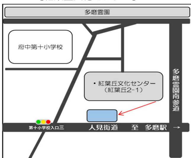
【紅葉丘文化センター】