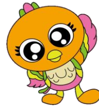
元気一番!!ふちゅう体操 イメージキャラクター ひばビー

(対象) : おおむね65歳以上の府中市民 (講座時間) : 60分 (申込期間) : 5/1～5/18 ※申込期間を過ぎた場合はご相談ください。 (申込み方法) : お電話でお申込みください。