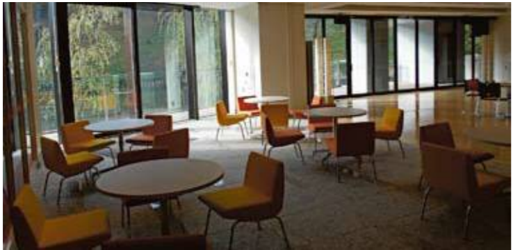
ひだまりホールは、多世代交流拠点として大災害の際にも活用されます。