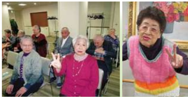
元旦の新年祝賀会後に歌会が開かれました

連雀デイサービスでは、正月飾りの門松を作りました。画用紙を丸めて竹に、和紙に細かく切れ目を入れ竹串に巻きつけ松を作り、扇子等の飾りを付け土台に友禅和紙を使用し、門松が完成しました。「素敵な物ができた」「さっそく玄関に飾った」と皆さん仕上がりに満足され、手作りの門松と共に2016年を迎えられました。