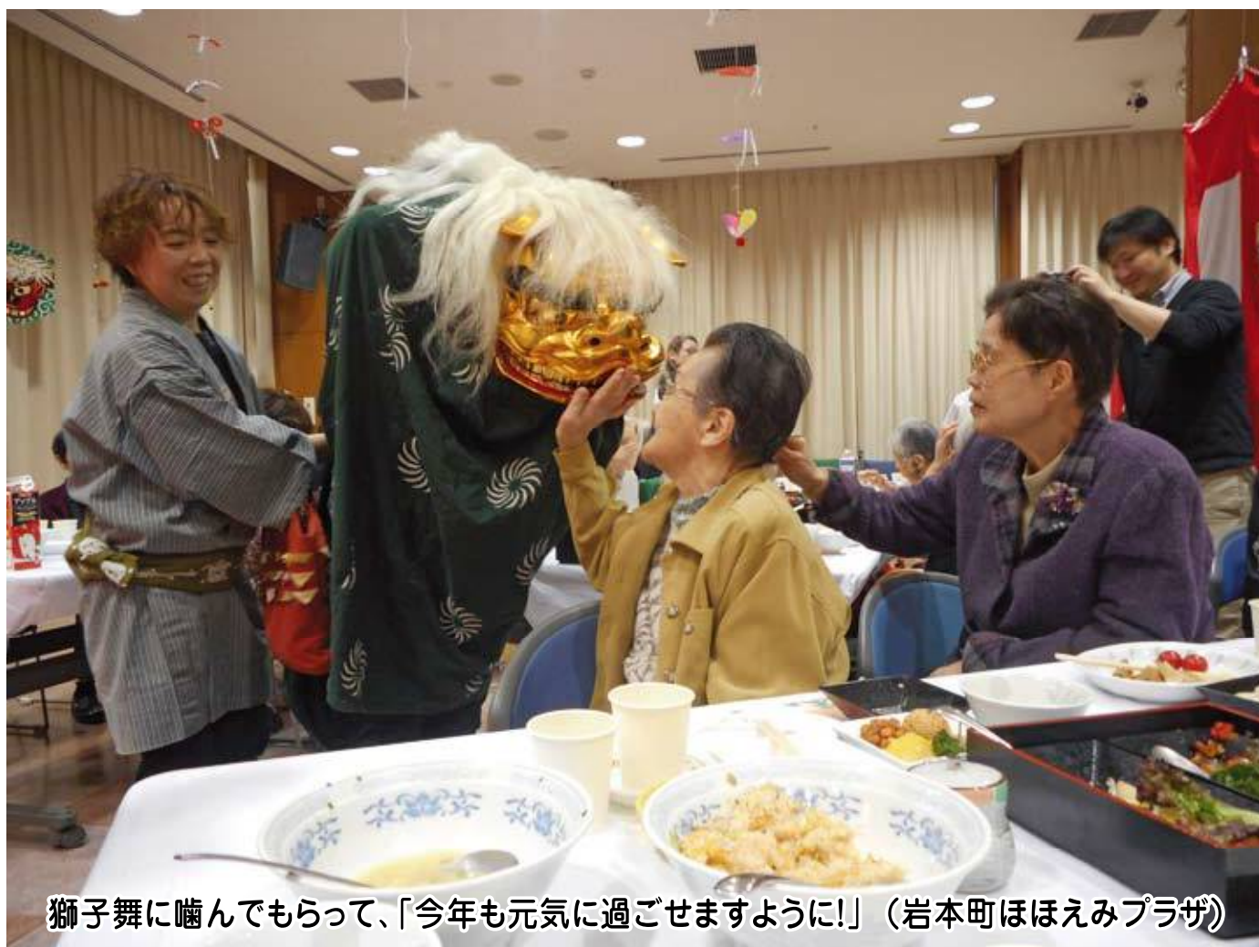
獅子舞に噛んでもらって、「今年も元気に過ごせますように！」（岩本町ほほえみプラザ）