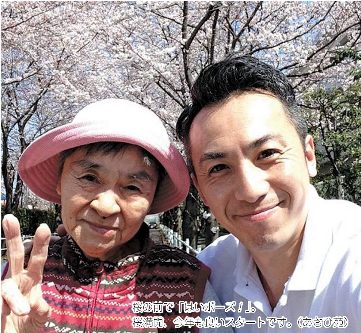
桜の前で「はいポーズ!」。 桜満開、今年も良いスタートです。(あさひ苑)