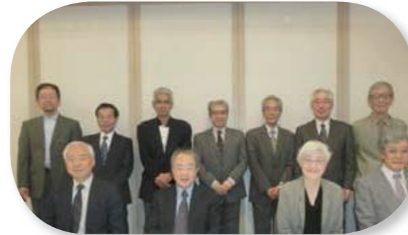
理事・監事のみなさん (欠席1名) (平成29年6月15日第294回理事会)