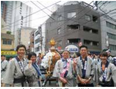
多摩同胞会職員の雄姿