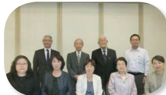
評議員のみなさん (欠席2名) (平成29年6月15日定時評議員会)