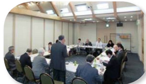
平成29年度定時評議員会の様子