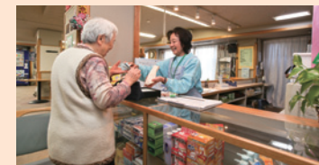
喫茶「グリーン茶房」 日用品も販売している喫茶は、毎日営業。地域の方もご利用いただけます。