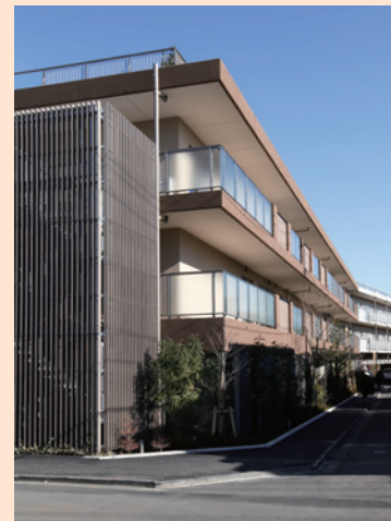
外観/正面玄関 やわらかな佇まいは、閑静な住宅街にとけこんでいます。