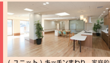
(ユニット)キッチンまわり 家庭的な雰囲気のキッチンとリビング。やわらかな光があたたかです。