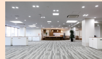
防災拠点型地域交流スペース 災害時、避難所として活用可能な多目的スペースです。