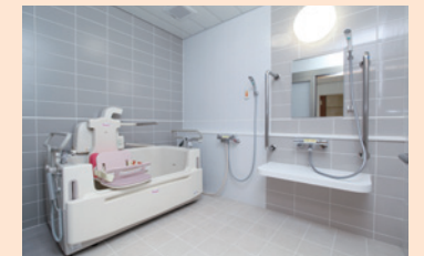
浴室 一人の空間を大切に考えた浴室です。