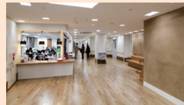
ロビー・事務所カウンター 土壁が印象的なロビーには、総合案内カウンターがあります。