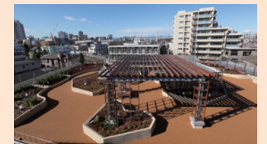
庭園 新しい緑苑を象徴する、緑いっぱいの庭園です。