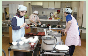
調理・配膳 手作りにこだわった、安心・安全な食事を提供しています。