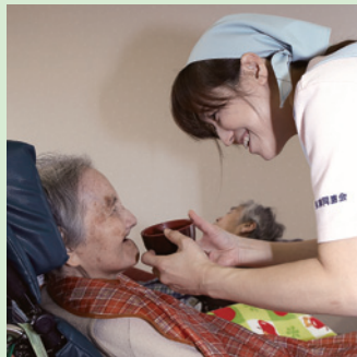
食事 「おいしい。ありがとう!」。笑顔と共にお手伝いさせていただきます。