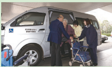
デイサービスのお迎え 「おはようございます!」の挨拶と共に皆さんをお迎えます。