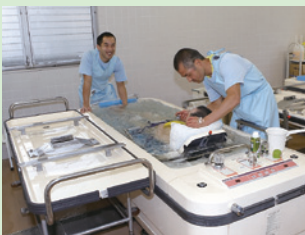
浴室 安心安全を心がけています。心も身体もリフレッシュできます。