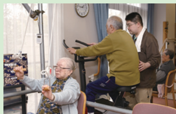
機能訓練室 体力維持を目標に、楽しみを持って運動をしています。