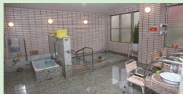
浴室 自宅での入浴が難しい場合でも、安心して入浴ができる環境です。