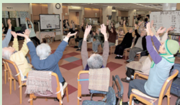
デイ活動室 体操の活動のほかにもゲーム・手工芸の活動、音楽の活動を行っています。