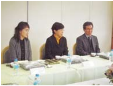
中央の方が伊委員長

11月17日、きずなにおいて調印式を行い、今後の交換研修のあり方について協議しました。それぞれの国の文化・歴史、福祉制度を学び、お互いの仕事に活かしていくことを再度確認しました。