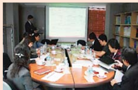
社会福祉士の役割と利用者(地域住民)とのかわり等を伺いました。