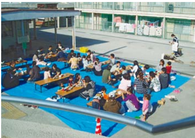
晴れた日には屋外で交流会が開かれます

母子生活支援施設では、DV被害者が多く入所していますが、入所に至らないで地域で苦しみながら生活している方も沢山います。そうした母と子どもを守るために施設では積極的に支援し、DV被害者の現状を社会に訴えていきたいと思えます。