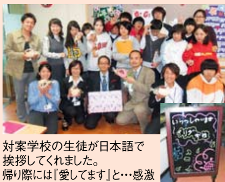
対案学校の生徒が日本語で挨拶してくれました。帰り際には『愛してます』と…感激