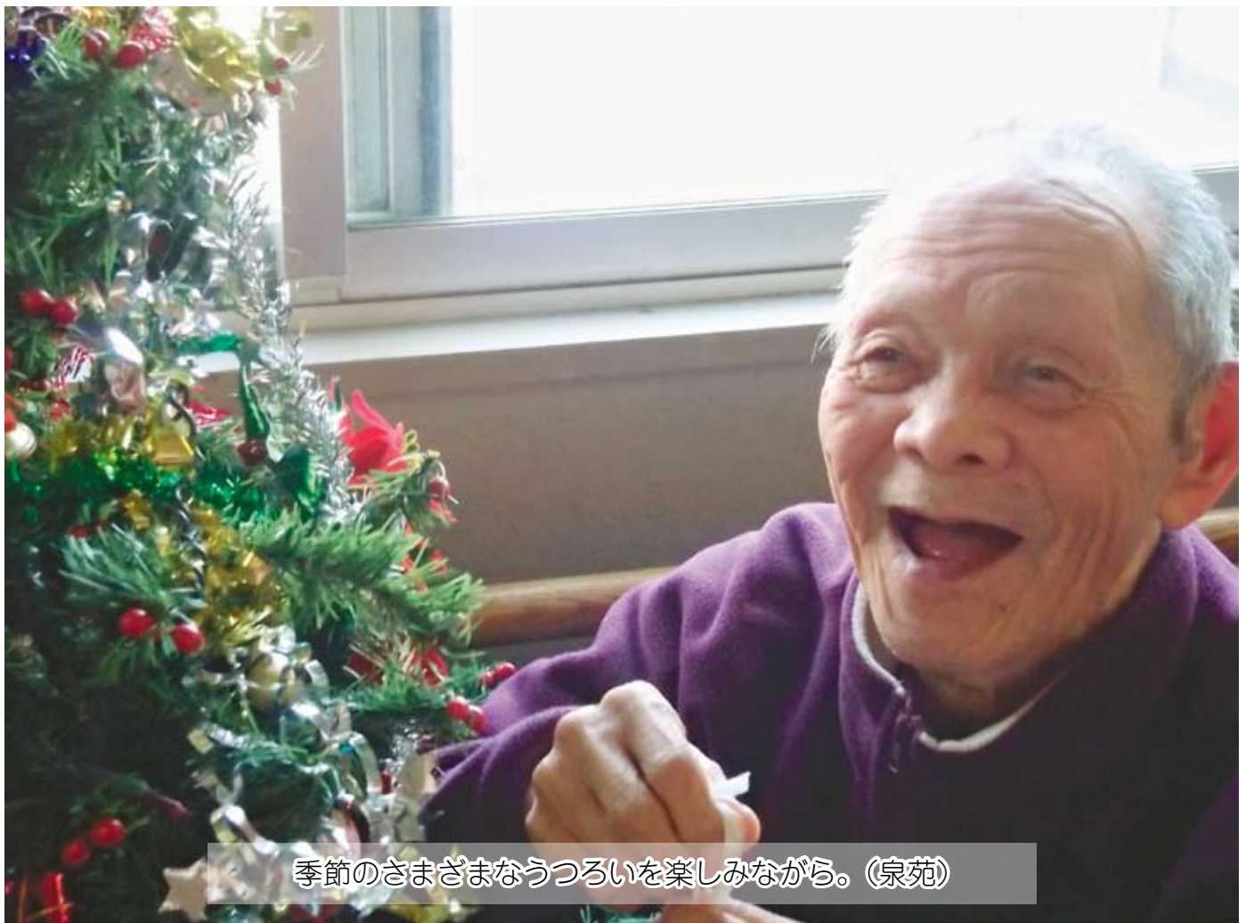
季節のさまざまなうつろいを楽しみながら。(泉苑)