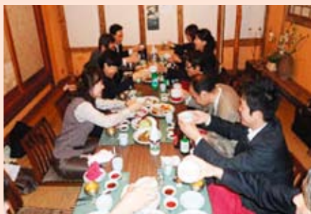
歓迎晩餐会 スラッカン料理の数々