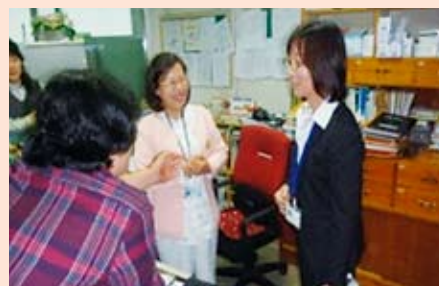
看護師同士、意気投合!