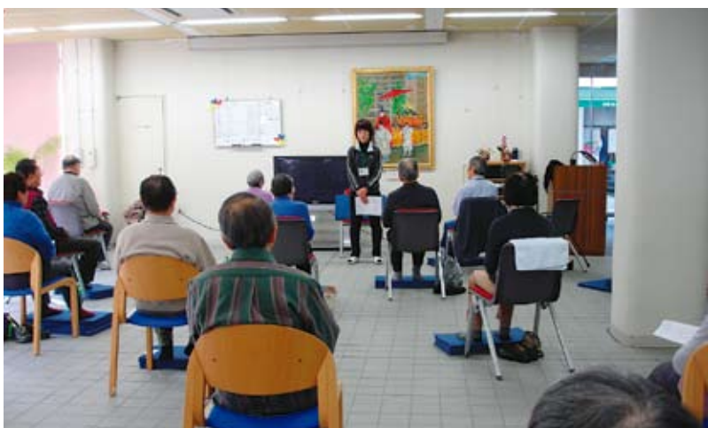
介護予防講座の風景

と伝えなければならないこともある、緊急事態なら拒否されてもしなければならぬこともある。ただひとつ、「私たちが大事にしななければならないこと」を見失わなければ、自分の仕事に確信を持つことができま すし、その場では先が見えずに「何をやっているんだろう」と思ったとしても、いつかは道が開けてくるものと思っています。