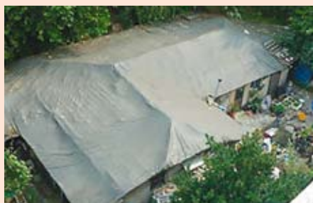
シンリン総合社会福祉館屋上から地域の様子を撮影。開発で高層住宅が建設される一方、多世帯同居の古い住宅がある。(シート屋根の家は8世帯が暮らしている長屋式の住居)