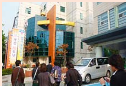
ヨンドンポ老人総合福祉館