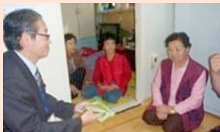
独り暮らしのお宅を訪問。隣近所の方が自然に見守りをしていました。(2軒訪問) 右は自宅設置用の緊急通報装置。→