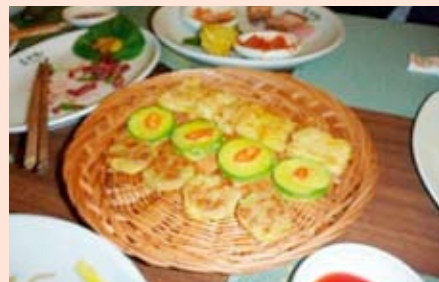
これが本当のチジミです。