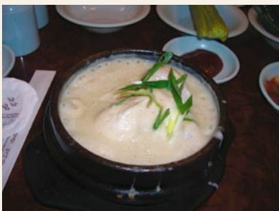
韓国料理サムゲタン