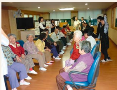
デイサービスの活動