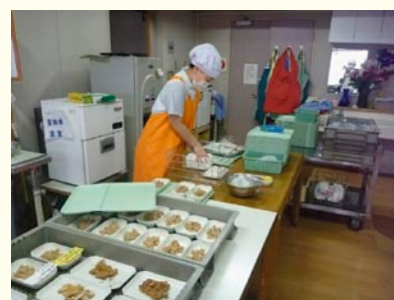
工事期間中のフロアーでの配膳

特養ホームでは大きく食事提供方法を変えました。今までは、温冷配膳車により、お一人分ずつ食事をセットしていましたが、工事期間中はフロアーでの配膳となりました。2階・3階の食堂の一部を使用し、食事係の職員が食事を盛り付け、介護職員と一緒に、お一人分ずつお盆に乗せながら配膳していきます。今までとは勝手が違い、慣れるまでには時間がかかりました。またいつもと違う雰囲気に着かれないご利用者もいらっしゃいました。しかし、食事係職員がフロアーに足を運ぶことにより、ご利用者の生活を知ることのできる機会も得、他部署との距離がすこし近くなりました。工事期間中の食事内容は、契約業者のご理解、ご協力や、法人他施設の協力を得ながら真空調理法で作成した食事（煮物・炒め物・お浸し類等）と市販品を組み合わせて提供しました。 約6週間という時間は、泉苑の慣れ親しんだ味（食事）が、忘れられてしまうようで心配でした。でもそれは「顔の見える食事作り」「誰かを思って作るごはん」というものが、飽きのこない食事作りにつながり、心と身体力の源につながっていることを実感する期間でもありました。そんな不安を少しでも埋めてくれたのは、法人内の同じ気持ちで食事を作っている仲間でした。