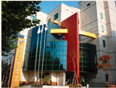
ヨンドンポ老人総合社会福祉館

ソウル市の高齢者に特化した福祉館で、大規模で重要な福祉拠点です。とても勉強になりました。