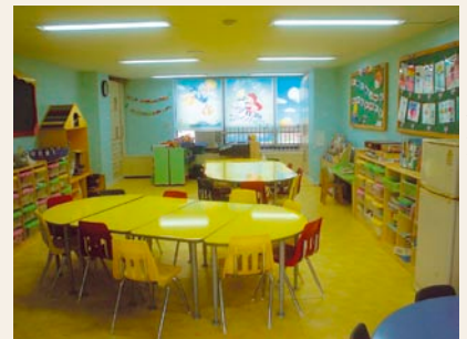
シンリン福祉館の学童の教室