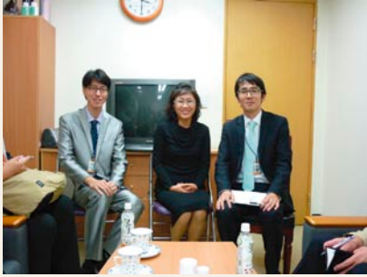
ヨンドンポの社会福祉士、生活援助員