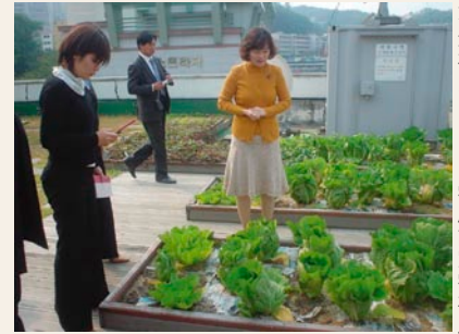
不登校児のための学歴認定学校屋上菜園

ソウル市の高齢者に特化した福祉館で、大規模で重要な福祉拠点です。とても勉強になりました。