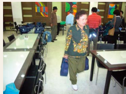
ボランティアの皆さん