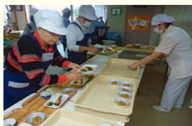
デイサービスの配膳