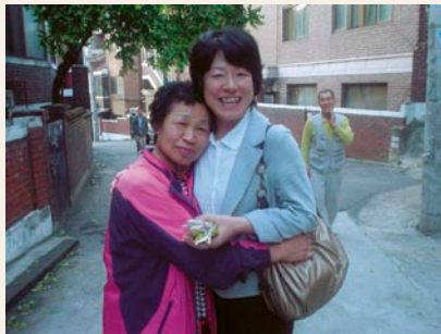
心に残るこの一枚《日韓友好編》