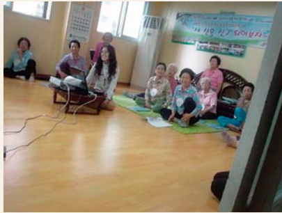
敬老堂 ～関節炎予防教室～