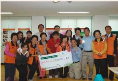
オレンジ奉仕団の皆さん