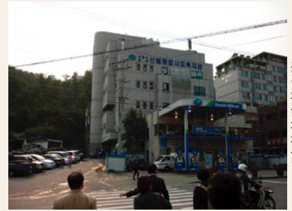
シンリン総合社会福祉館