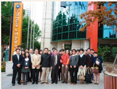
ヨンドンポの館長さん、職員の方皆さん