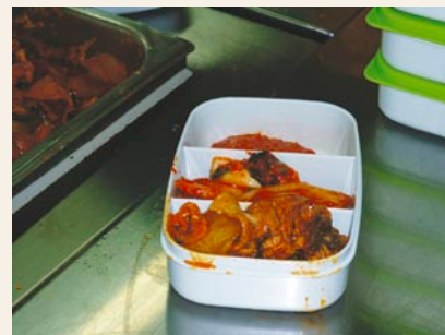
訪問食事今日のメニュー