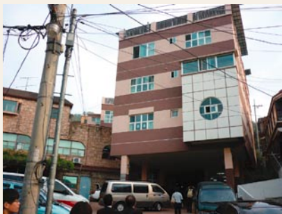
ドンミョン老人福祉センター