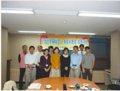
シンリンの館長さん、職員の方皆さん