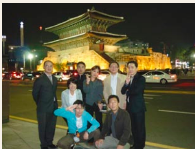
東大門前にて記念撮影