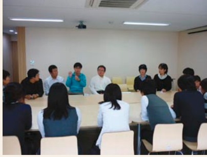
シンリン対案学校