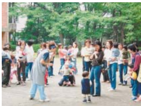
ワイワイ、ガヤガヤするだけでもストレス発散できますよね。