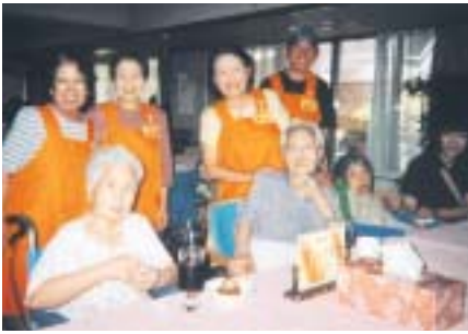
いつも明るいうらら会のみなさん。