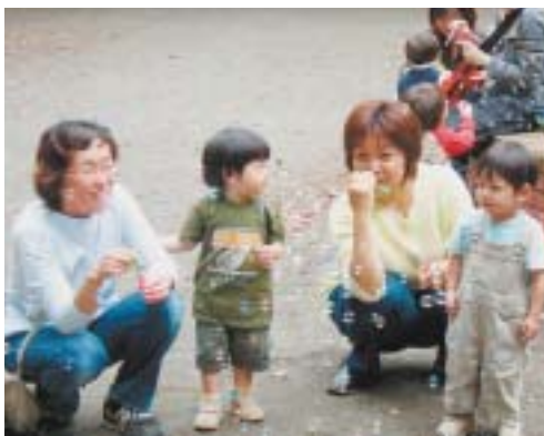
この日がシャボン玉初体験。ストローに穴を開けると小さい子どもも安心です。