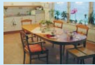
明るいキッチンと食堂

朝食 7時から10時頃が起床と食事の時間です。メニューはシリアル、オートミール、パンやヨーグルトとコーヒー、紅茶の軽食です。個人によって起床時間がまちまちなので朝食時間が長くとってあります。また朝食だけは厨房では作らず各ユニットごとに作ります。喫茶店のような雰囲気があります。