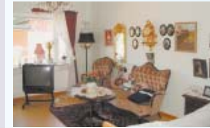
ゆったりとした居室

入浴 スウェーデンでの入浴はシャワー浴が主になります。寝た状態で浴びるシャワー浴と各居室にあるシャワーで簡単に浴びることが出来ます。回数は週に1回が基本です。スウェーデンは気候が乾燥しているため、たびたび入浴することは肌に良くないと考えられています。ペーガヒューセンでは起床介助時に実施していました。